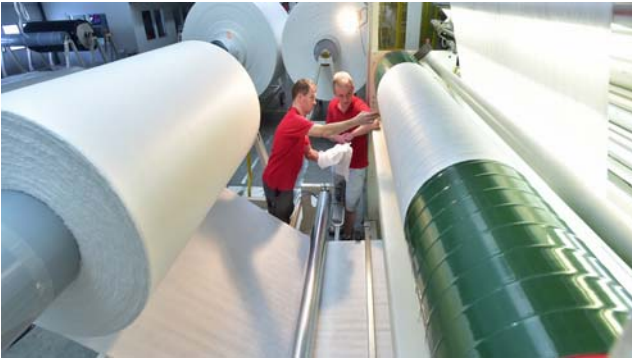
Blick in die Produktion von Norafin